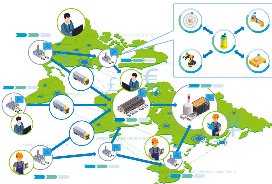
Abbildung 2 Paradigmenwechsel der Planung und Steuerung von Wertschöpfungsnetzen

Mit dem aufgezeigten Paradigmenwechsel geht auch ein Wandel des Controllings der logistischen Systeme einher. Wo in der Vergangenheit u. a. klassische Kosten- / Nutzenanalysen durchgeführt worden sind, müssen zukünftig neue Bewertungsgrundlagen, die quantitativ die Flexibilität und Wandelbarkeit der Systeme integrieren, entwickelt werden. (siehe Abb. 2)