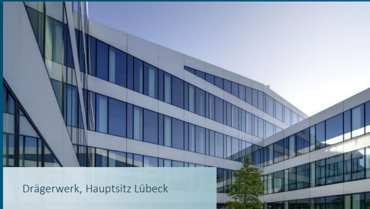
Drägerwerk, Hauptsitz Lübeck